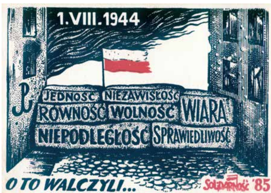
25. Karta pocztowa upamiętniająca powstanie warszawskie, 1985, wyd. Solidarność, autor nieznany, ze zbiorów Europejskiego Centrum Solidarności, sygn. POCZ_000624 (tymczasowa)