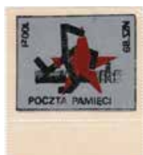
17. Znaczek pocztowy z symbolicznym wyobrażeniem współpracy nazistów i Sowieców, 1989, wyd. Poczta Pamięci/NZS, autor nieznan, ze zbiorów Archiwum Historycznego Komisji Krajowej NSZZ Solidarność, brak sygnatury