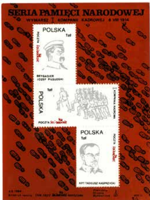
6. Blok wydany w ramach cyklu Seria pamięci narodowej , upamiętniający wymarsz I Kompanii Kadrowej, 1986, wyd. Piwnicza Oficyna Wydawnicza/TKW NSZZ Solidarność Warszawa, autor nieznany, ze zbiorów Europejskiego Centrum Solidarności, sygn. AOZ_0480 (tymczasowa)