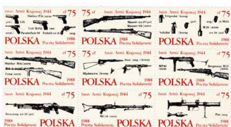
26. Arkusz składający się z dziewięciu różnych znaczków pocztowych, na których prezentowana jest broń Armii Krajowej, 1988, wyd. Poczta Solidarność, autor nieznany, ze zbiorów własnych