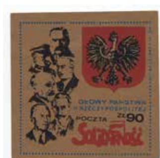
10. Blok z wizerunkami głów państwa z okresu II Rzeczypospolitej, 1986, datowanie za: Andrzej Jaworski, Towarzystwo Poczty Podziemnej. Katalog znaczków rok 1986 , s. 77, wyd. Poczta Solidarność, autor nieznany, ze zbiorów Archiwum Historycznego Komisji Krajowej NSZZ Solidarność, brak sygnatury