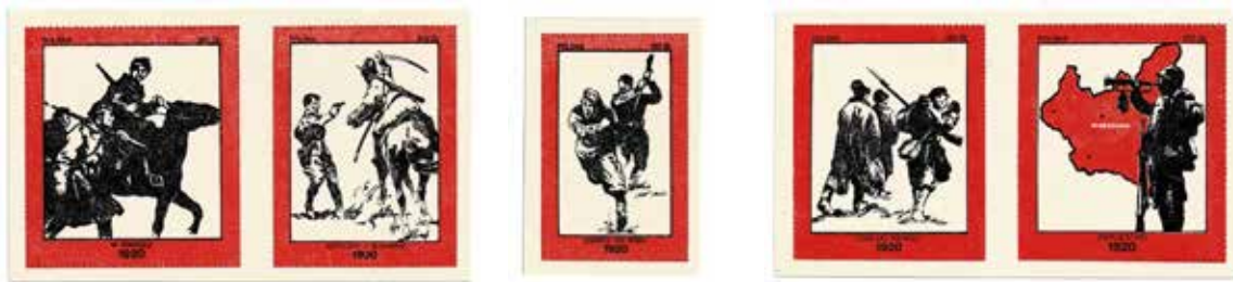
11. Zestaw znaczków pocztowych odnoszących się do wojny polsko-rosyjskiej 1919–1921, 1988, datowanie za: Endzel, Katalog znaczków , t. 5, brak informacji o wydawcy, autor nieznany, ze zbiorów własnych