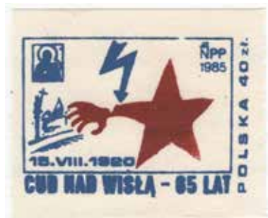
12. Znaczek pocztowy upamiętniający 65 rocznicę „cudu nad Wisłą” (z serii z różnymi wydarzeniami) – jeden z wariantów kolorystycznych, 1985, wyd. Niezależna Poczta Pomorza, autor nieznany, ze zbiorów Archiwum Historycznego Komisji Krajowej NSZZ Solidarność, brak sygnatury