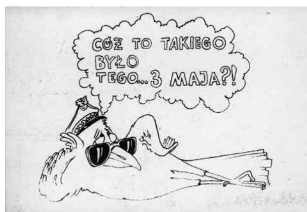
3. Karta pocztowa z satyryczną grafiką nawiązującą do uchwalenia Konstytucji 3 maja, niedatowana, brak informacji o wydawcy, autor nieznany, ze zbiorów Europejskiego Centrum Solidarności, sygn. POCZ_000570 (tymczasowa)