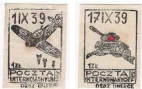
16. Dwa znaczki pocztowe przypominające daty wkroczenia wrogich armii na teren Polski w 1939 r., 1982, wyd. Poczta Internowanych/Obóz Uherce, autor nieznan, ze zbiorów Archiwum Historycznego Komisji Krajowej NSZZ Solidarność, brak sygnatury