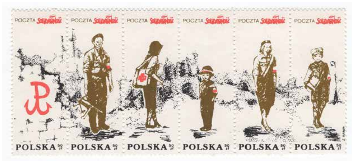
23. Pasek ze znaczkami pocztowymi przedstawiającymi bohaterów powstania warszawskiego – dostępne różne warianty kolorystyczne, (1) 1987, datowanie za: Sokołowski, Katalog znaczków , s. 122; (2) 1988, datowanie za: Endzel, Katalog znaczków , t. 4, wyd. Poczta Solidarność, autor nieznanym, ze zbiorów Archiwum Historycznego Komisji Krajowej NSZZ Solidarność, brak sygnatury