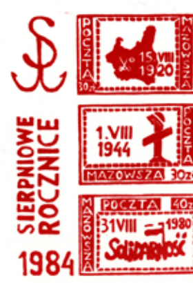
27. Blok upamiętniający sierpińskie rocznice, 1984, wyd. Poczta Mazowska, autor nieznany, ze zbiorów Europejskiego Centrum Solidarności, sygn. AOZ_0156 (tymczasowa)