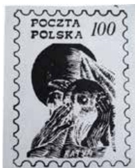
20. Znaczek pocztowy z wizerunkiem Matki Boskiej Katyńskiej, 1988, datowanie za: Endzel, Katalog znaczków , t. 4, wyd. Poczta Polska, autor nieznanym, ze zbiorów Instytutu Pamięci Narodowej, sygn. IPN BU 3549/148, karta nienu-merowana