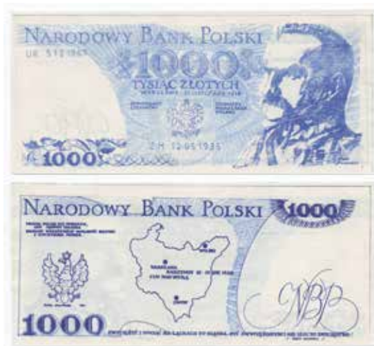
15. Awers i rewers „banknotu” z wizerunkiem Piłsudskiego, niedatowany, brak informacji o wydawcy, autor nieznan, ze zbiorów Archiwum Historycznego Komisji Krajowej NSZZ Solidarność, brak sygnatury