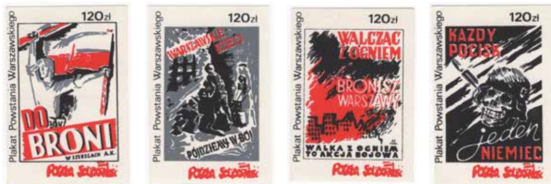
24. Seria znaczków pocztowych z reprodukcjami plakatów z okresu powstania warszawskiego, (1) 1987, datowanie za: Sokołowski, Katalog znaczków , s. 123; (2) 1988, datowanie za: Endzel, Katalog znaczków , t. 4, wyd. Poczta Solidarność, autor nieznany, ze zbiorów Archiwum Historycznego Komisji Krajowej NSZZ Solidarność, brak sygnatury.