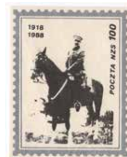
14. Znaczek pocztowy z wizerunkiem Piłsudskiego – jeden z wariantów kolorystycznych, 1988, wyd. Poczta NZS, autor nieznany, ze zbiorów Archiwum Historycznego Komisji Krajowej NSZZ Solidarność, brak sygnatury