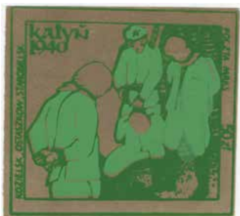
21. Znaczek pocztowy upamiętniający zbrodnię katyńską z przedstawieniem sceny mordu – jeden z wariantów kolorystycznych, 1987, datowanie za: Sokołowski, Katalog znaczków , s. 42, wyd. Poczta MRKS, autor nieznanym, ze zbiorów Archiwum Historycznego Komisji Krajowej NSZZ Solidarność, brak sygnatury