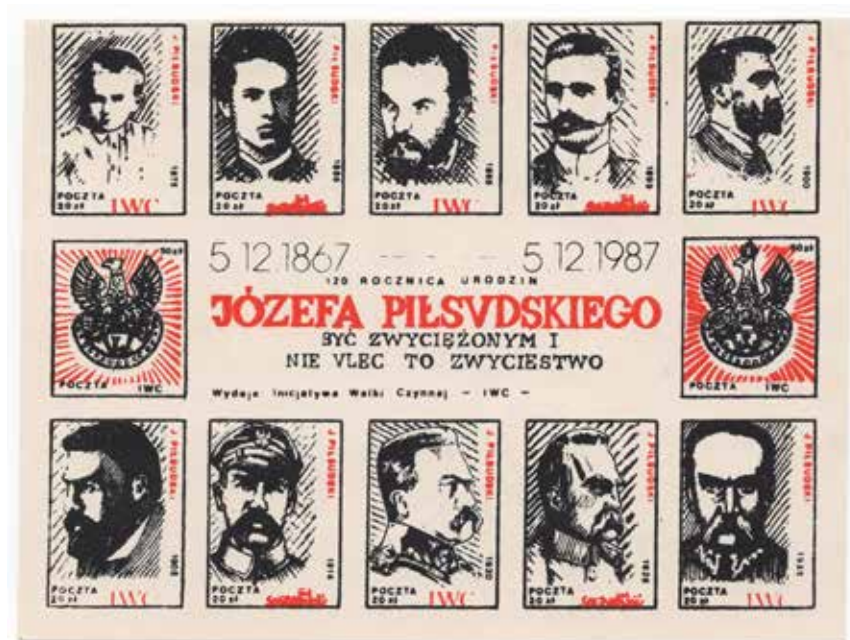
13. Blok z dziesięcioma różnymi wizerunkami Piłsudskiego, 1987, wyd. Poczta IWC/Poczta Solidarność, autor nieznany, brak sygnatury