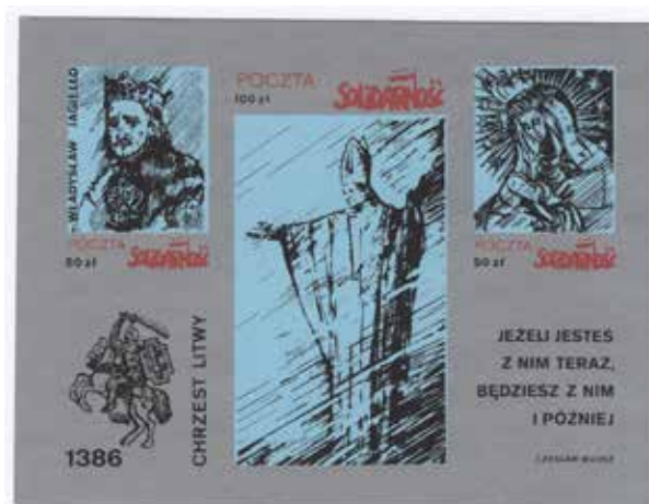
1. Bloki upamiętniające chrzest Polski i Litwy: (1) 1987, datowanie za: Wacław Sokołowski, Katalog znaczków wydawanych przez polskie organizacje niezależne w 1987 roku , s. 27; (2) 1988, datowanie za: Zbigniew Endzel, Katalog znaczków poczty podziemnej , t. 4, wyd. Poczta Solidarność, autor nieznany, ze zbiorów Archiwum Historycznego Komisji Krajowej NSZZ Solidarność, brak sygnatury