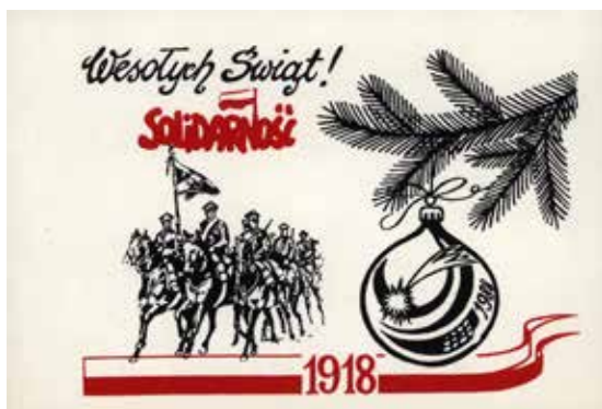
8. Świąteczna karta pocztowa upamiętniająca 70 rocznicę odzyskania niepodległości, 1988, wyd. Solidarność, autor nieznany, ze zbiorów Europejskiego Centrum Solidarności, sygn. POCZ_000444 (tymczasowa)