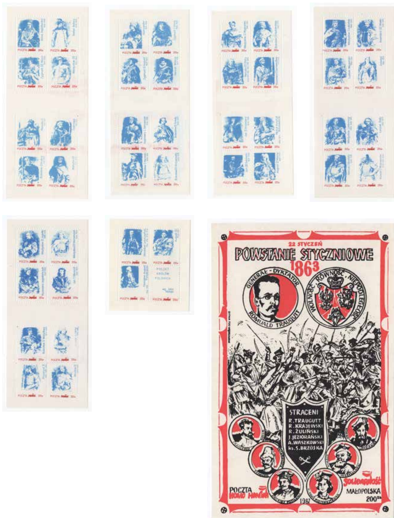
4. Emisje z reprodukcjami portretów polskich władców według pocztu Matejki – jeden z wariantów kolorystycznych, niedatowany, wyd. Poczta Solidarność, autor nieznany, ze zbiorów Archiwum Historycznego Komisji Krajowej NSZZ Solidarność, brak sygnatury