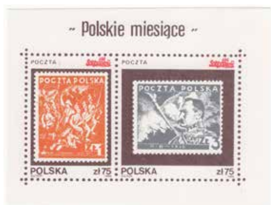
28. Blok z serii upamiętniającej wydarzenia rozgrywające się w poszczególnych miesiącach, 1986, wyd. Poczta Solidarność, autor nieznanym, ze zbiorów Archiwum Historycznego Komisji Krajowej NSZZ Solidarność, brak sygnatury