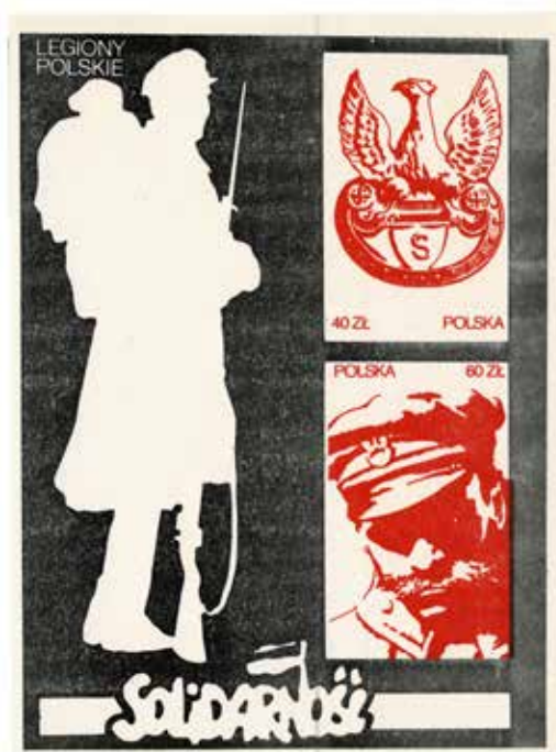
7. Blok poświęcony Legionom Polskim – wybrany wariant z serii, 1987, datowanie za: Sokołowski, Katalog znaczków , s. 129, wyd. Solidarność, autor nieznany