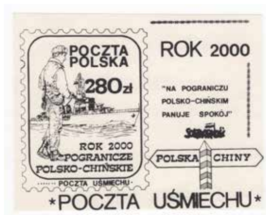
29. Blok odnoszący się do przyszłości – wizualizacja roku 2000, 1988, datowanie za: Endzel, Katalog znaczków , t. 4, wyd. Poczta Uśmiechu, autor nieznanym, ze zbiorów Archiwum Historycznego Komisji Krajowej NSZZ Solidarność, brak sygnatury