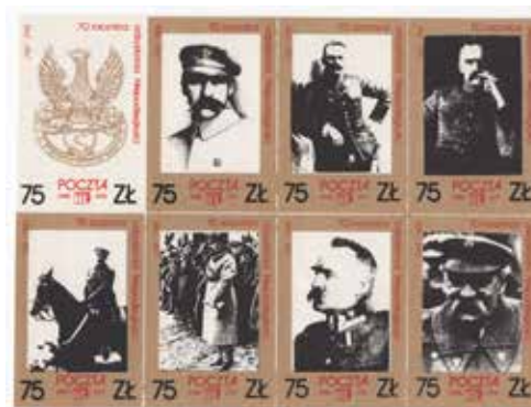
9. Arkusz ze znaczkami pocztowymi zawierającymi reprodukcje portretów Piłsudskiego, 1988, wyd. Poczta HLS/Nowa Huta, autor nieznany, ze zbiorów Archiwum Historycznego Komisji Krajowej NSZZ Solidarność, brak sygnatury