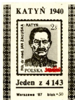
22. Znaczek pocztowy z serii Katyn 1940 – Jeden z 4 143 – na reprodukowanym egzemplarzu wizerunek Jana Załuskiego, 1987, wyd. Solidarność, autor nieznanym, ze zbiorów Archiwum Historycznego Komisji Krajowej NSZZ Solidarność, brak sygnatury