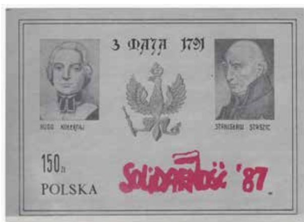
2. Walor upamiętniający rocznicę uchwalenia Konstytucji 3 maja, 1987, wyd. Solidarność, autor nieznany, ze zbiorów Archiwum Historycznego Komisji Krajowej NSZZ Solidarność, brak sygnatury