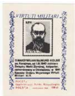
19. Znaczek pocztowy z serii Virtuti Militari – na reprodukowanym egzemplarzu zamieszczono wizerunek o. Maksymiliana Kolbego, 1988, wyd. Poczta Konfederacji Polski Niepodległej, autor nieznanym, ze zbiorów Archiwum Historycznego Komisji Krajowej NSZZ Solidarność, brak sygnatury